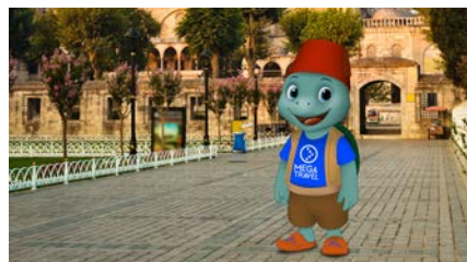
Fondo: Mezquita, mercado o desierto