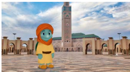
Fondo: pirámides, zoco o desierto marroquí