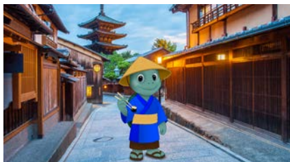
Fondo: templos, jardines, murallas o mercados flotantes