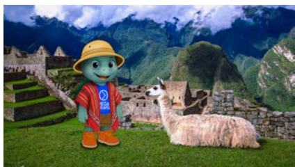
Fondo: Machu Picchu o Valle Sagrado