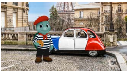
Fondo: Torre Eiffel, Coliseo o algún tranvía de Lisboa