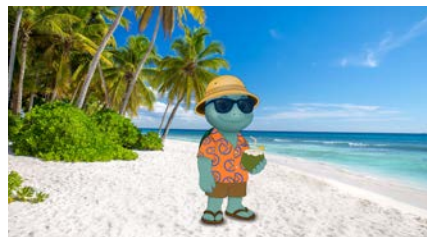
Fondo: palmeras, mar o cabañas sobre el agua